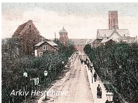
Ribe havde som Paris fået sin egen "Champs-Élysées" !

dem, gennemskar ham dem og fjernede forhindrede murværk. Herved opstod de såkaldte "strygejern-huse". Den nye avenue fik navnet "Stationsvejen", senere ændret til "Dagmarsgade". Det blev i øvrigt én af de første planlagte gader i byen.