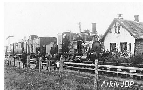
Farup Trinbræt ca. 1890