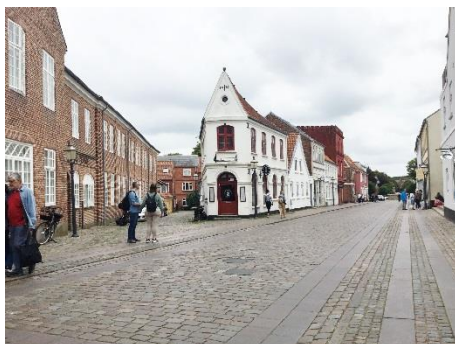
Værtshus "Strygejernet" i Dagmarsgade